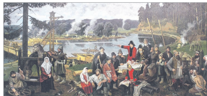
Рождение города Ижевска.