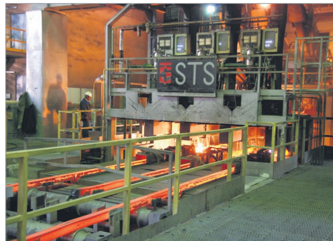
Машина непрерывного литья заготовок.