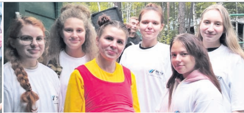
Наши волонтеры, много лет помогающие организовывать праздники для детей работников комбината. Скоро девчонки заканчивают 11-й класс, но обещают нас не забывать