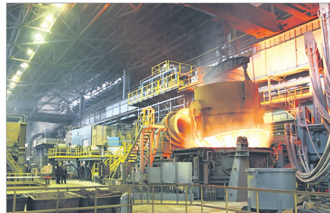
ДСП-40. Завалка шихты.