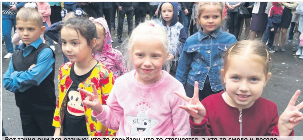
Вот такие они все разные: кто-то серьёзен, кто-то стесняется, а кто-то смело и весело смотрит в объектив и — в завтрашний день...