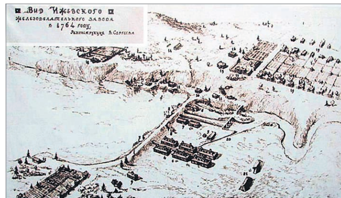
Ижевск. 1764 год.